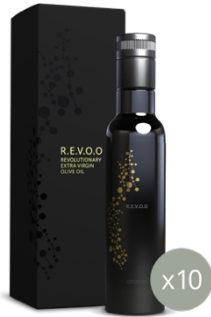
R.E.V.O.O Prepaid Kit