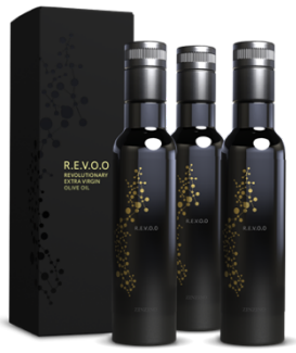
R.E.V.O.O Start Kit